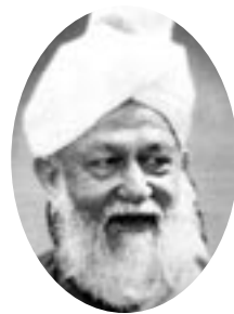
Hazrat Mirza Tahir Ahmad rh Khalifatul Masih IV 1928-2003