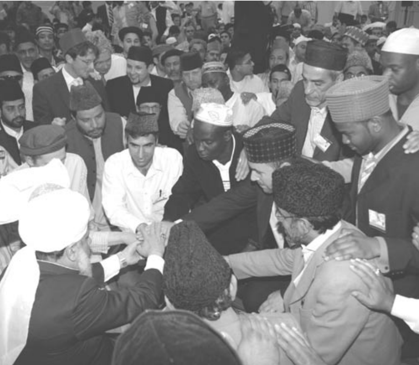
Hierboven en omslag: Baiat-ceremonie, waarin leden van de Ahmadiyya Moslim Djamaat de eed van trouw affiegeen aan de huidige kalief, Mirza Masroor Ahmad (aba). Baitunnoer, Nunspeet, 18 juni 2006.