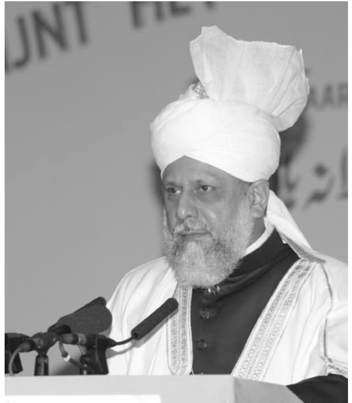
Hazrat Mirza Masroor Ahmad (aba), Khalifatul Masih V in Nunspeet