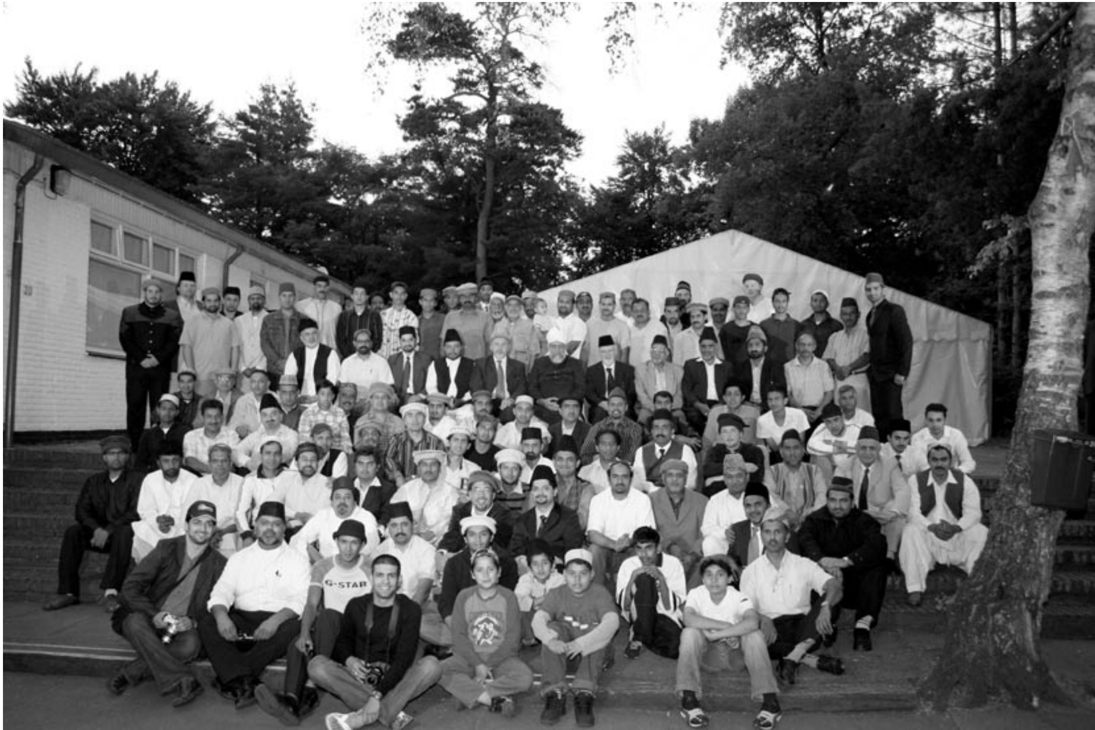
Khalifatul Masih V (aba) met medewerkers van Jalsa Salana Nederland 2006 bij Baitunnoer te Nunspeet, op 20 juni 2006.