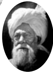
Hazrat Mirza Bashiruddin Mahmood Ahmad ra Khalifatul Masih II 1889-1965