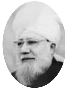
Hazrat Mirza Nasir Ahmad rh Khalifatul Masih III 1909-1982