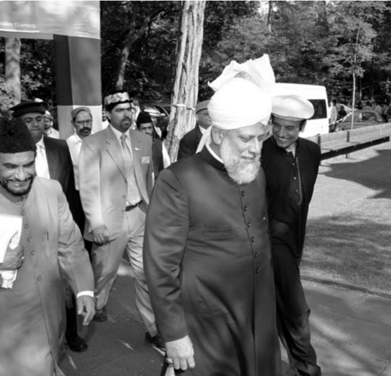
De vijfde kalief van de Ahmadiyya Moslim Djamaat, Hazrat Mirza Masroor Ahmad (aba) bij Baitunnoer, Nunspeet, juni 2006..

Hazrat Mirza Ghulam Ahmad a stichtte de Ahmadiyya Moslim Jamaat in 1889, en begon daarmee het toelaten van mensen in de Djamaat als leden. Op basis van goddelijke openbaringen verklaarde hij in 1890 zowel de Beloofde Messias als de Beloofde Mahdi te zijn. Hij verklaarde ook een onderdanig profeet te zijn aan Hazrat Mohammad s die van de Almachtige Allah de taak heeft gekregen om de godsdienst van Hazrat Mohammad s te dienen.