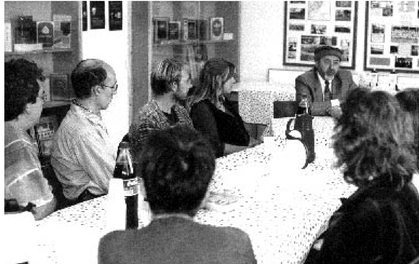
Open Dag Mobarak Moskee, 7 Oktober 2001