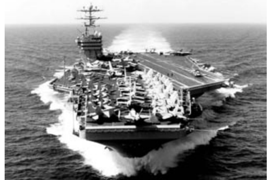
Geheel boven: olieraffinaderij in Frankrijk. Hierboven: Het Amerikaanse vliegdekschip George Washington.